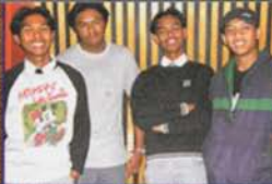
Pelajar S.M.K.I. Indonesia