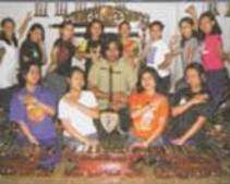
"ARJUNA" Di Menara Kegemilangan