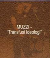
MUZZI - "Transfusi Ideologi"