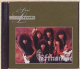
LEFTHANDED - Keadilan