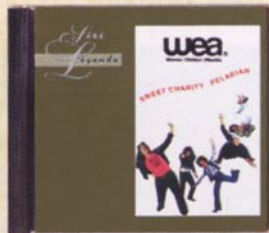
SWEET CHARITY - Pelarian