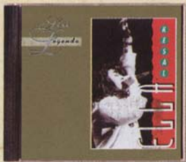
ELLA - Kesal