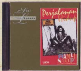
RAMLI SARIP - Perjalanan Hidup