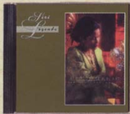
YUSNI HAMID - Senandung Lagu Melayu