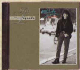
ELLA - Puteri Kota