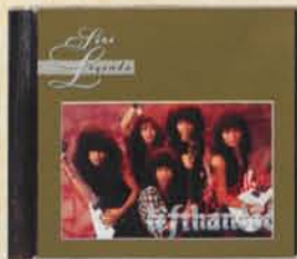
LEFTHANDED - Keadilan