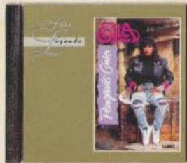
ELLA - Pengemis Cinta