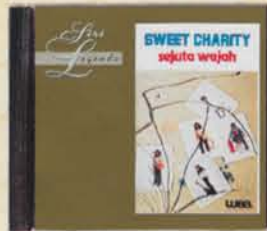
SWEET CHARITY - Sejuta Wajah