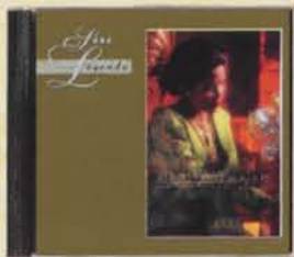
YUSNI HAMID - Senandung Lagu Melayu