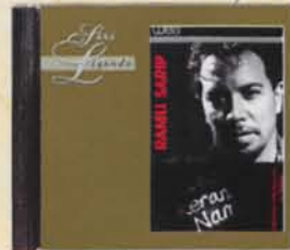
RAMLI SARIP - Bukan Kerana Nama