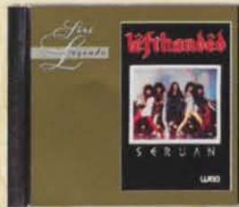
LEFTHANDED - Seruan