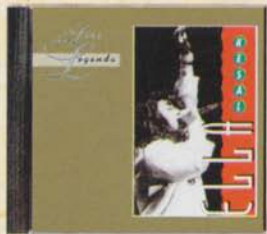
ELLA - Kesal