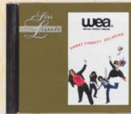
SWEET CHARITY - Pelarian