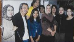
Teman & Keluarga Musik Di Indonesia