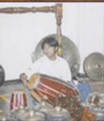
Iman - Gendang Sunda (S.M.K.I.)