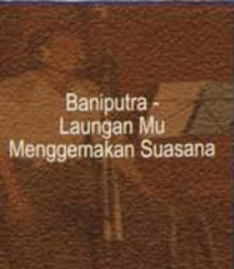
Baniputra - Laungan Mu Menggemakan Suasana