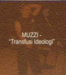
MUZZI - "Transfusi Ideologi"