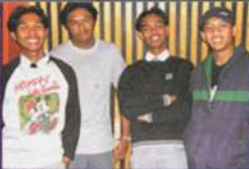
Pelajar S.M.K.I. Indonesia