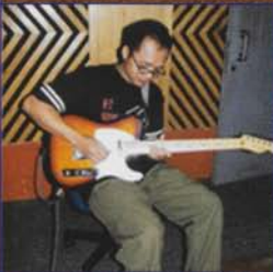
Ucok - Walaupun "Berdarah" Ku Tetap Tabah