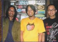
Tenaga/Teman Di YESS Studio (Bandung)