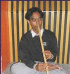
AEP - Suling Bambu Mempersona